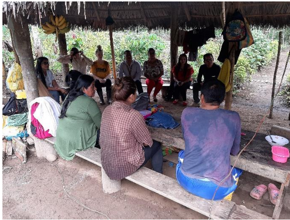
Miembros de la comunidad apoyando con mingas para las diferentes actividades en la construcción de la casa de capacitación, reuniones, recibiendo a visitantes, socialización de KAWSAK SACHA.